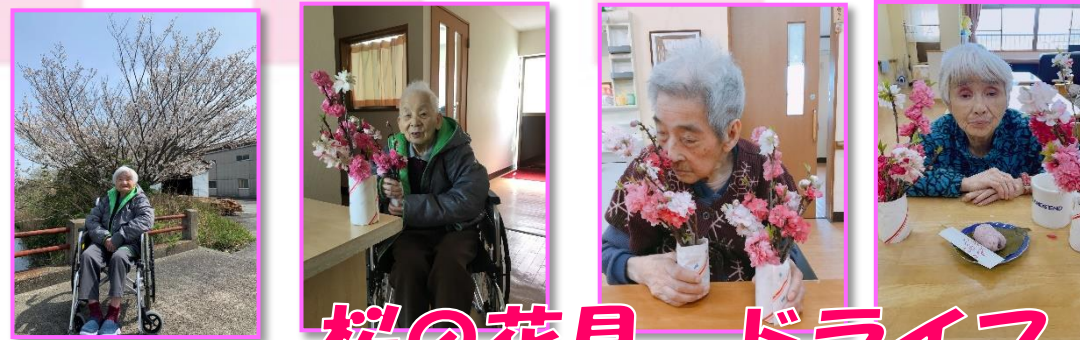
桜の花見 ドライブ